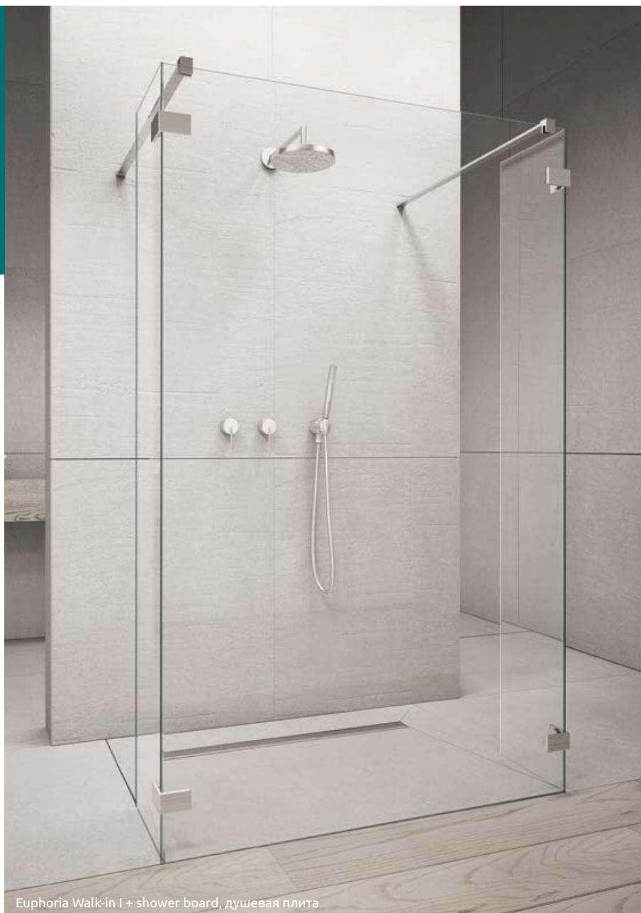
Euphoria Walk-in I + shower board, душевая плита

Shower enclosure set consists of 3 parts: Front wall W4 and two sidewalls SW . Please specify all the article numbers when making an order. В заказе надо указать 3 номера артикулов: фронтальной части W4 и двух боковых стенок SW